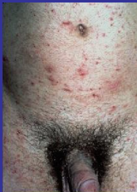
Scabies + steroid