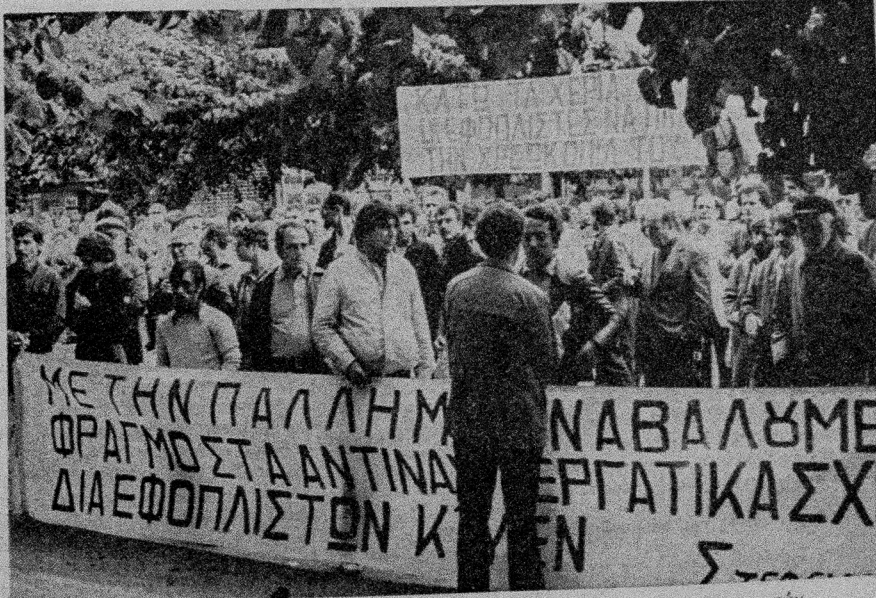
Στιγμιότυπο από την μεγαλειώδη συγκέντρωση και πορεία των ναυτεργατών

Σε συνέχεια, αναφέρθηκε στην κατακόρυφη μείωση της αγοραστικής δύναμης των μισθών των εργαζομένων κατά 30 ο ενώ ΣΥΝΕΧΕΙΑ στην 3η σελ.